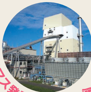
バイオマス発電って何？

原子力科学館で魔法の霧箱を作って、普段、目に見えない放射線の足跡を観察します。 (霧箱は持ち帰られません) また、生活での放射線の利用について、展示館を見学しながら学びます。