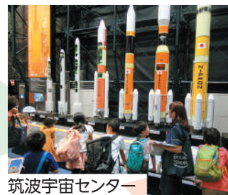
筑波宇宙センター